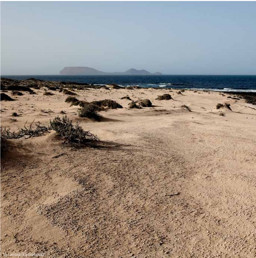
La Lambra (La Graciosa)