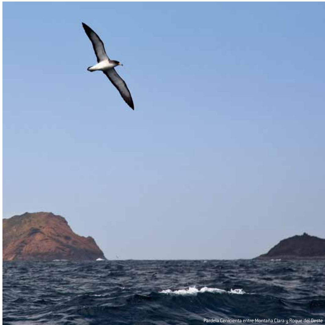
Pardela Cenicienta entre Montaña Clara y Roque del Oeste