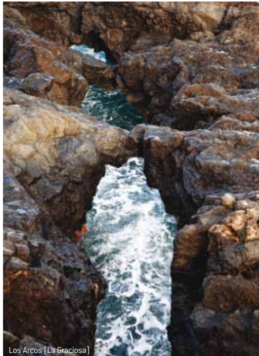
Los Arcos (La Graciosa)

excelente riqueza natural donde abundan peces como la vieja, sama, salemas, meros, abades,... y más de 300 especies de macroalgas, albergando la mayor biodiversidad marina de Canarias. Estos recursos explican la abundancia de aves marinas y por eso también ha sido declarada Zona Especial de Protección para las Aves. Aquí se encuentra una de las poblaciones más numerosas de Europa de la pardela cenicienta y entre las especies más raras y amenazadas está el paño pechialbo y también cernícalos, lechuzas, el halcón de Eleonor y el guincho o águila pescadora. Sin duda, un lugar ideal para su cría y reproducción bajo la responsable protección del hombre.