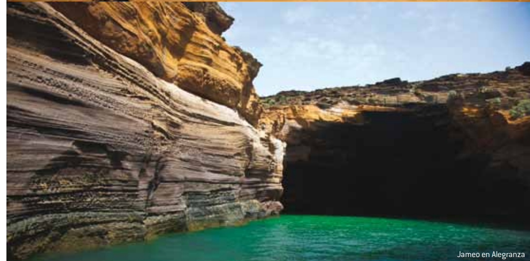
Jameo en Alegranza