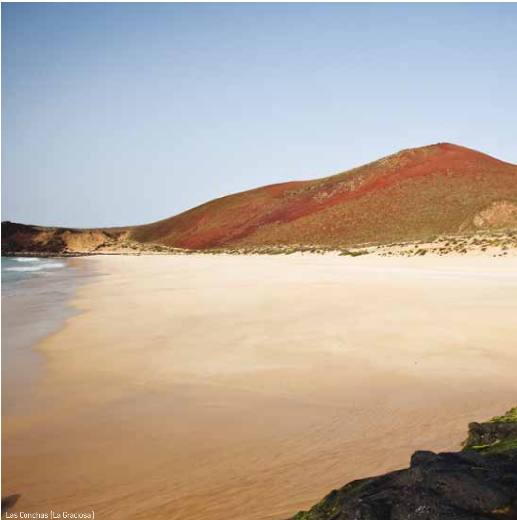
Las Conchas (La Graciosa)