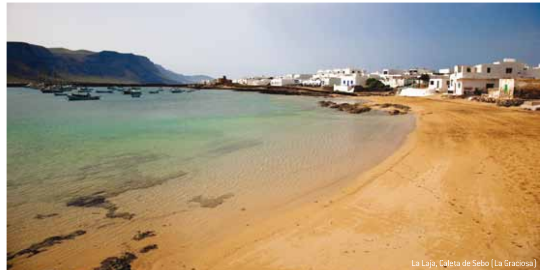
La Laja, Caleta de Sebo (La Graciosa)